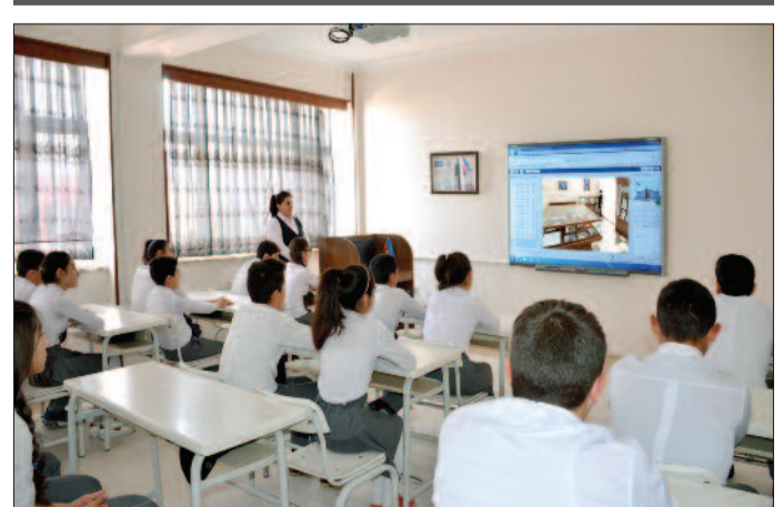
Babək qəsəbə 1 nömrəli tam orta məktəb