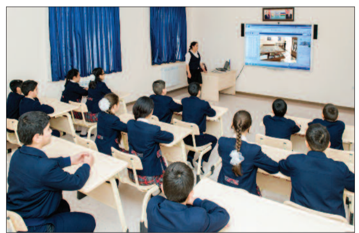
Naxçıvan şəhər 3 nömrəli tam orta məktəb

Qeyd edək ki, Naxçıvan Muxtar Respublikası Ali Məclisi Sədri İlham Əliyevin "Naxçıvan Muxtar Respublikasının təhsil müəssisələrində elektron təhsilin təşkili ilə bağlı əlavə tədbirlər haqqında" 2014-cü il 20 iyun tarixli Sərəncamı muxtar respublikada elektron təhsilin tətbiqinin genişləndirilməsinə, eyni zamanda təhsil müəssisələrində virtual tədris mühitinin formalaşdırılmasına hərtərəfli şərait yaradıb.