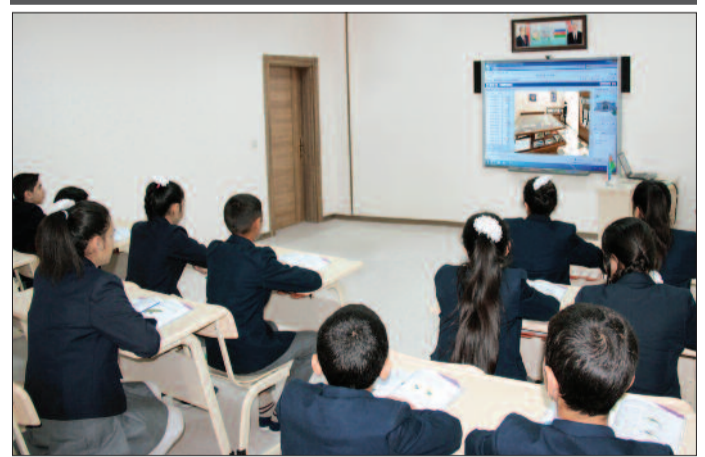
Şərur şəhər 2 nömrəli tam orta məktəb